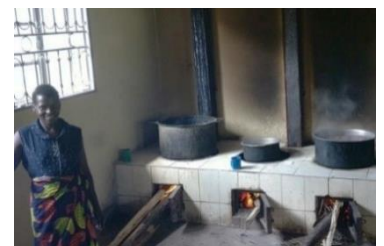
Zubereitung des Essens auf holzsparenden Öfen in der neuen Küche

Bereits im letzten Jahr starteten wir das Projekt „Eine Mahlzeit für jedes Kind“ an der staatlichen Mutolere Primary School, die vorrangig von Kindern äußerst armer Familien besucht wird.