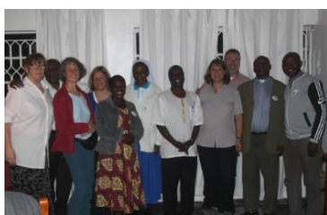
Die Gründung der Sektion Mutolere feierten wir gemeinsam mit unseren neuen Mitgliedern und Gästen.

Unsere Klausurtagung im Juli nutzten wir daher unter anderem dazu, über neue Wege der Zusammenarbeit nachzudenken. Dabei war das Ziel, die Aufgaben besser zu verteilen und eine sichere Basis für unsere zukünftige Arbeit zu schaffen. Während unserer Herbstreise konnten wir erste Schritte in diese Richtung gehen.